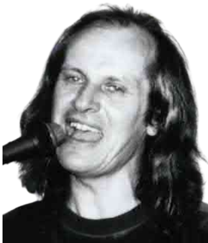
Foto z bohoslužby v Římě v kostele sv. Dona Boska. Jako salesiánští studenti hráli a zpívali při jáhenském svěcení spolubratrů, je to asi z roku 1991.