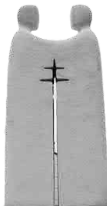
Sousoší sv. Cyrila a Metoděje na Petrově v Brně

Metoděj se vracel na Moravu ve shodě s přáním umírajícího Cyrila. Byl jmenován arcibiskupem pro Moravu a Panonii, slovanská bohoslužba byla uznána papežem