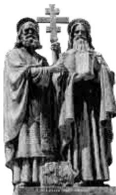
Sousoší věrozvěstů na Radhošti

A tak musel Metoděj čelit řadě křivých obvinění a útoků. Byl nucen se znovu vypravit do Říma obhájit své učení. Ačkoliv dosáhl schválení svého učení i práva, spory neustávaly. Působilo mu starosti, jak bude po jeho smrti. Zemřel o Velikonocích roku 885.