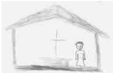
Jolča – venkovní mše svatá