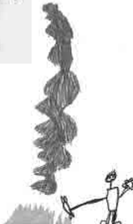
Miky – táborák s opékáním