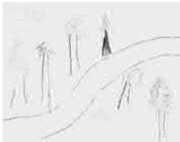
Běťka – putování lesem