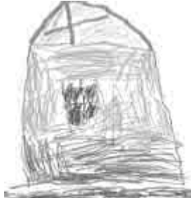
Andělka – kostel