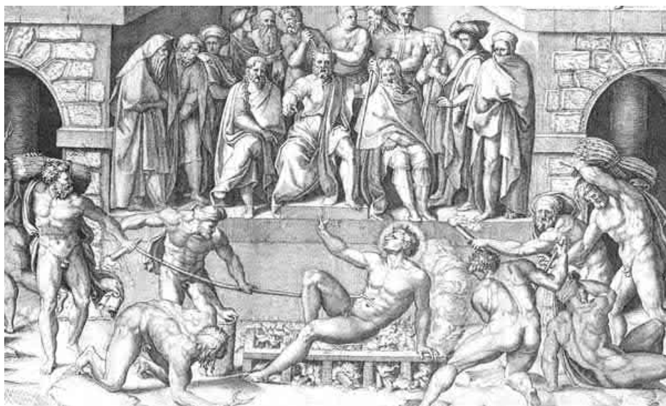
Umučení sv. Vavřince na rozpáleném roštu od Bartolommea Bandinelliho z roku 1525.