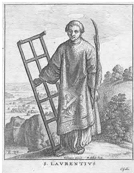
Svatý Vavřinec, podle Adama Elsheimera

Na místě, kde byl umučen, dal později císař Konstantin Veliký postavit baziliku. Ta byla ve 13. století přestavěna a dnes