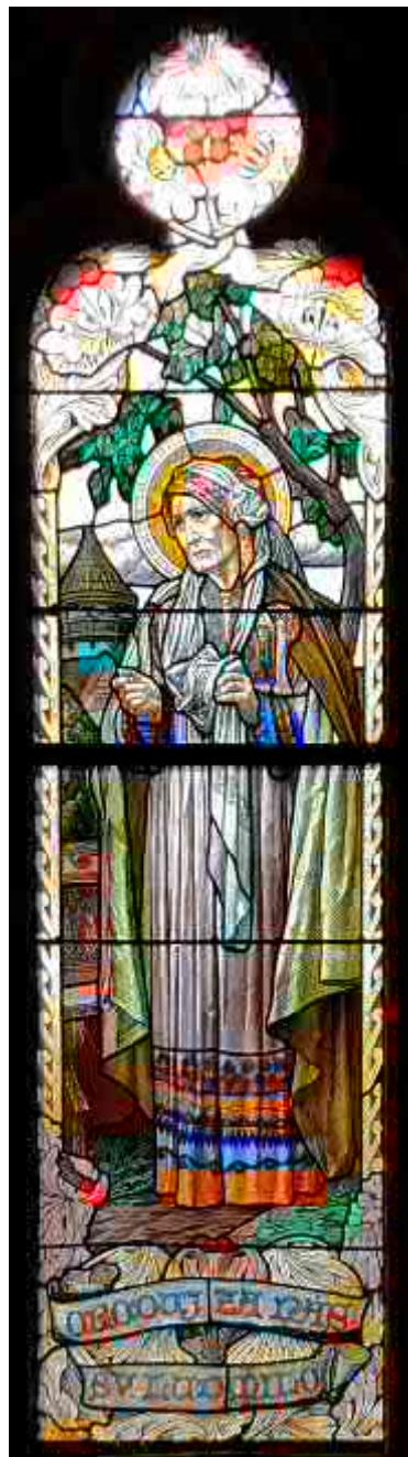
Vitráž v kapli Panny Marie u Augustiniánského domu.

Můžeme se usmívat uctívání stromů, klanění se pramenům, přinášení obětí bohům ohně, slunci, vodám. Hlavním smyslem