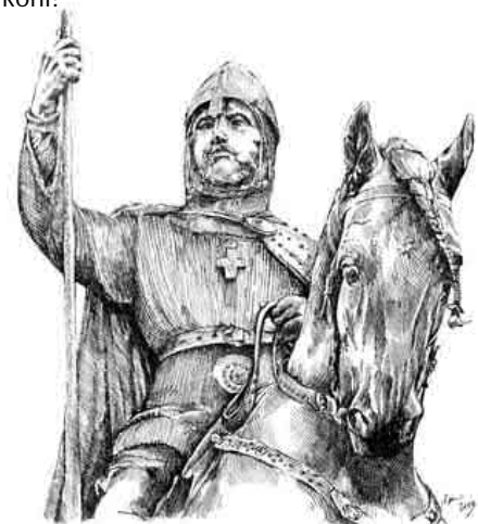
Svatý Václav od Miroslava Vomáčky zdroj: vendyatelier.cz

Víš kteří svatí bývají vyobrazováni na koni? Tento měsíc má jeden z nich svátek a druhému je zasvěcen kostel v Pozlovicích. Víš ještě o některém svatém na koni?