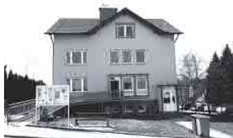
budova Charity Luhačovice

Uděl nám tuto milost na přímělu svatého Vincence z Pauly, patrona charitního díla, Ty, který žiješ a vládneš na věky věků. Amen.