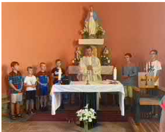
Mše svatá ve Vysokém Poli