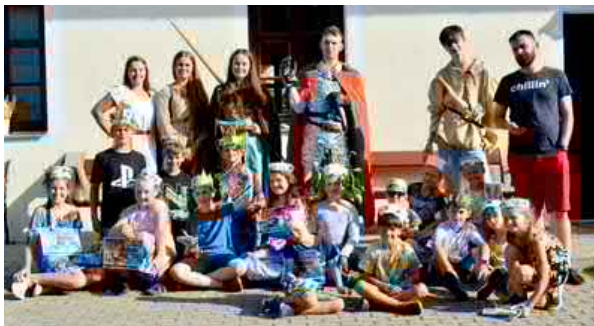
Farní tábor – mladší děti