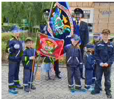
Oslavy 25. výročí kostela v Luhačovicích