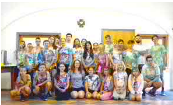
Farní tábor – starší děti