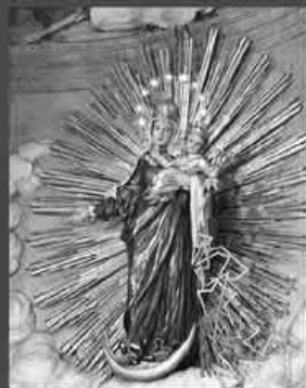
POUTNÍ BAZILIKA NANEBEVZETÍ PANNY MARIE NA SVATÉM HOSTÝNĚ 10. 9. 2022 V 18.00 HOD. VSTUPNÉ DOBROVOLNÉ