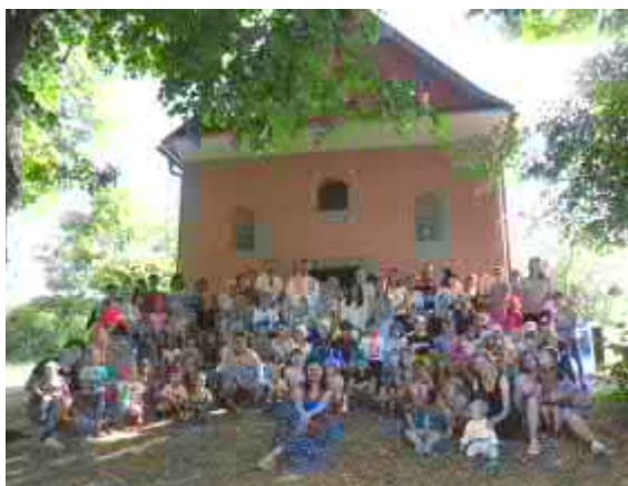
Společná fotografie poutníků do Vysokého Pole