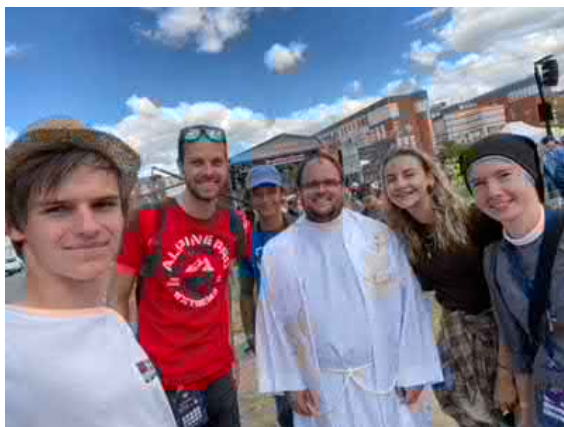
Celostátní setkání mádeže