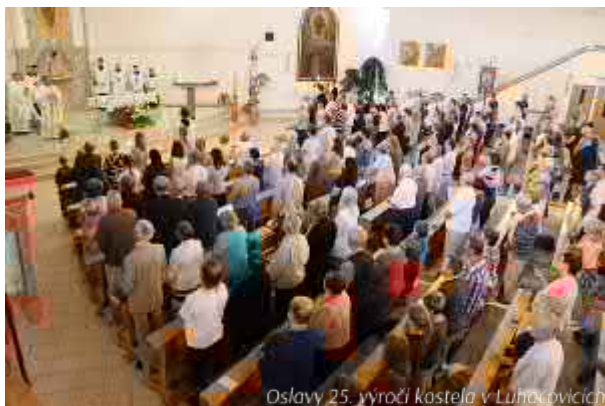
Oslavy 25. výročí kostela v Luhačovicích