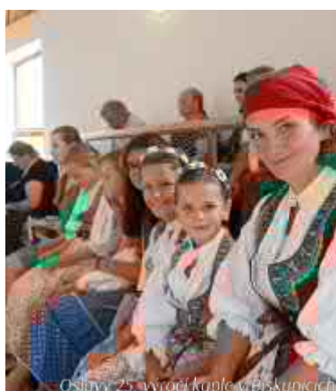
Oslavy 25. výročí kaple v Biskupičích