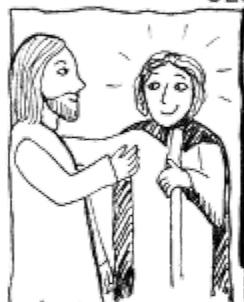
4. Ne. postní