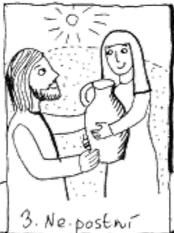
3. Ne. postní