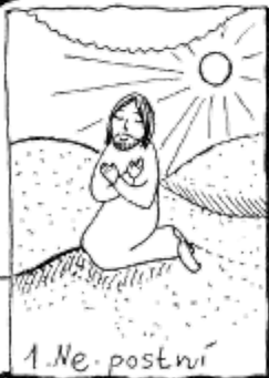
1. Ne. postní

Sem nakresli sám sebe na začátku cesty postní dobou!