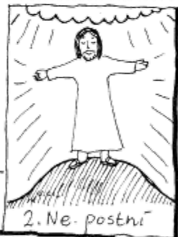
2. Ne. postní