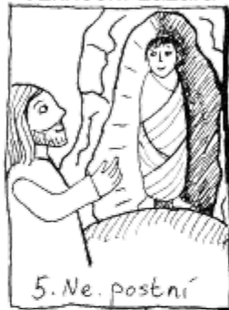
5. Ne. postní