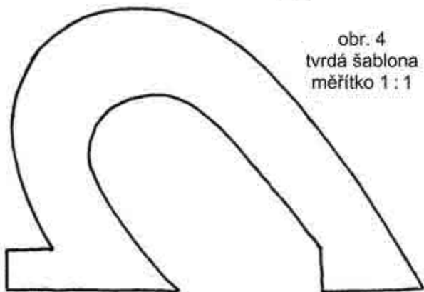
obr. 4 tvrdá šablona měřítko 1 : 1

----- čárkovaná čára = přehni papír - - - - - čerchovaná čára = střihej ✂