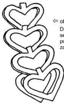
← obr. 6 Dvojitá srdce se do sebe postupně zavěšují.

Před začátkem adventu se rodina domluví, jak budou řetěz vytvářet. Každý člen může mít vlastní barvu srdíček, nebo budou srdíčka určitých barev znamenat určité dobré skutky (např. modlitbu, zřeknutí se něčeho, pomoc druhému...). Srdíčka si může každý zavěsit do řetězu na konci dne (při večerní modlitbě nebo před spaním) podle toho, co se mu podařilo vykonat, nebo prostě jako výraz vděčnosti Bohu. Na Vánoce řetěz ozdobí domácí vánoční stromek.