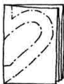
← obr. 5 Pozor na správné položení šablony (hřbet papíru vlevo, vpravo a dole jsou volné strany).

----- čárkovaná čára = přehni papír - - - - - čerchovaná čára = střihej ✂